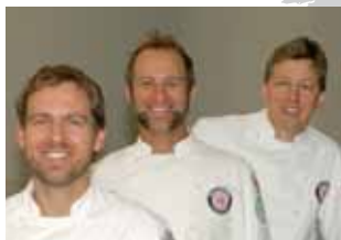
Equipo nacional de Estados Unidos