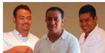
Equipo nacional de México