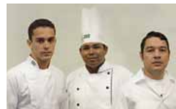
Equipo nacional de Brasil