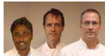
Equipo nacional de Canadá