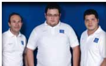
Equipo nacional de Costa Rica