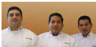
Equipo nacional de Perú