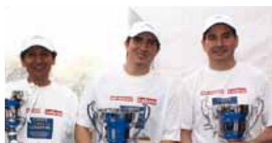
Equipo nacional de Chile