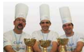
Equipo nacional de Argentina